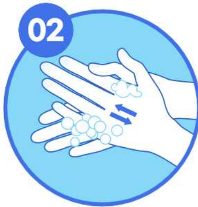
02 손등과 손바닥을 문지르기