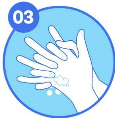
03 손가락지를 끼고 문지르기