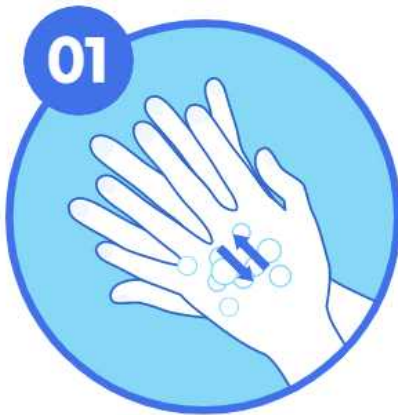
01 손바닥 마주대고 문지르기