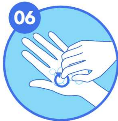
06 손톱 밑을 손바닥에 문지르기