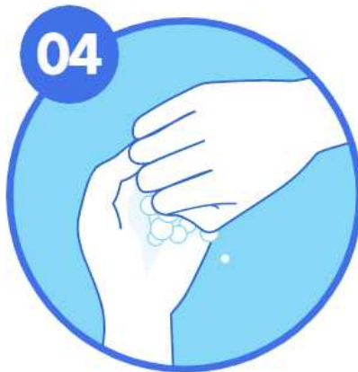
04 손가락 마주잡고 문지르기