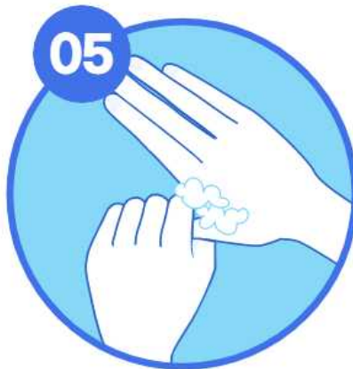
05 엄지손가락을 돌려주며 문지르기